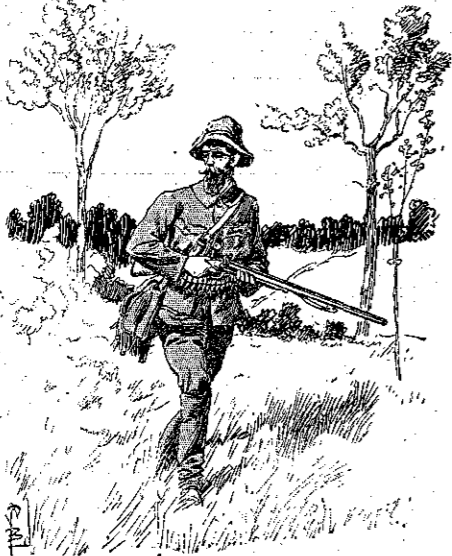
«Έγανε τον καιρόν του εις κυνήγια...» (Σελ. 29, στ. α').

Πρό όλίγου ήτο βυθισμένος εις την μεγαλύτεραν άπελπισίαν, επειδή δέν ήξευρε τί να κάμῃ. Άλλ' ίδού εξαφνα ένα μέλλον, που άνοίγετο τώρα εμπρός του!.. Ήτο μόνος εις τον κόσμο. Δέν είχαν