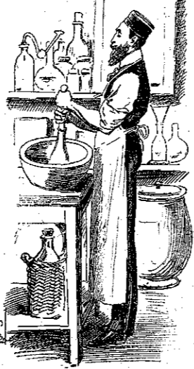
«Δέν έγγενήθηκα διά να κάμνω τον φαρμακοποιόν εις τό Σανλί!..» (Σελ. 30, στ. α').

ούτε γονείς, ούτε αδελφία, ούτε άλλούς στενοūs συγγενείς από τας τρεις εκείνας θείας, που δέν τον αγαπούσαν καθόλου. Διατί να μην υπάγῃ και αυτός εκεί-πέρα, όπως ο Τορπέν; Ο άγών, ή πάλη, τό άγνωστον... δέν τον έτρόμαζαν ούτε αυτόν. Άπεναντίας!.. Έπειτα τό ταξείδι... τό μεγάλο ταξείδι του Όκεανού... αι περιπέτειαι... Κάθε παιδί γοητεύεται με τό ταιό όνειρα!..